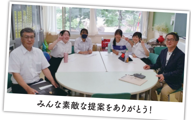
みんな素敵な提案をありがとう!