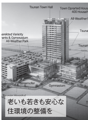
老いも若きも安心な住環境の整備を