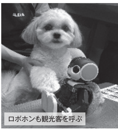
ロボホンも観光客を呼ぶ

町長 ふるさと納税をされた方には丁寧なお礼の手紙を出していたり、SNS「ワタシつなん」で情報発信をしている。また、「おてつたび」、ロボット観光、雪国観光圏の「帰る旅」、雪国リトリートでの地域との関係性を意識している。