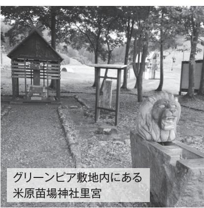
グリーンピア敷地内にある米原苗場神社里宮

町長 最大の転売防止策はプロジェクトが成功していくこと。信憑性のある方を選び実績を作り社会的責任を果たしていただきたい。